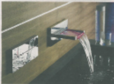
Naturmaterialien wie Holz werden im modernen Bad mit gedöckten Farben kombiniert.